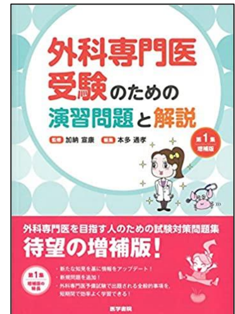
WO / 18 / Gek