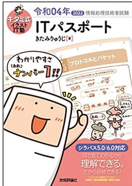
007.6 / Kit