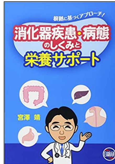
WI / 100 / Sho