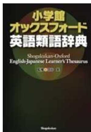
< 研究費購入分 >