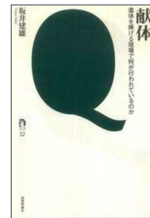
< 研究費購入分 >