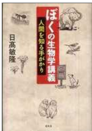
< 研究費購入分 >