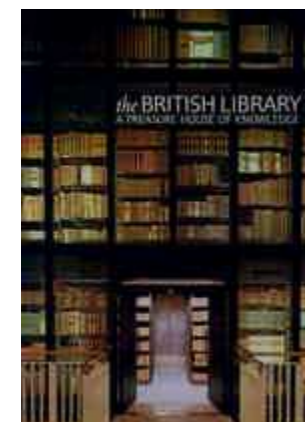
< 研究費購入分 >

2011年7月15日(金)の新着図書です。 新着展示コーナーに、一週間展示しています。