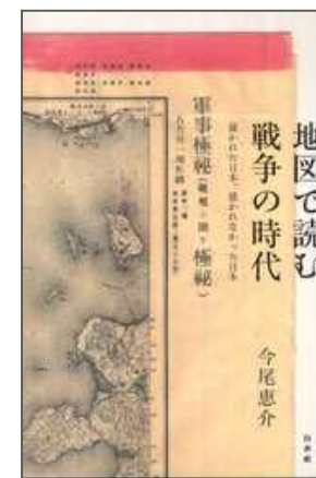
< 研究費購入分 >