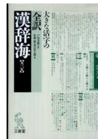
< 禁帯出資料 >