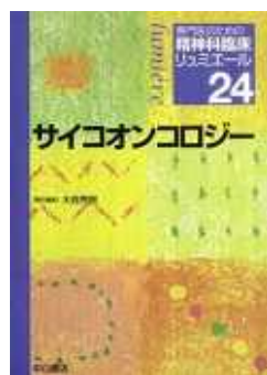
< 研究費購入分 >